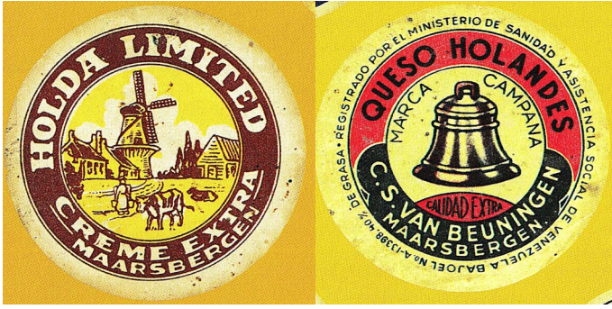
1952 Kaas labels van Beuningen, Anderstein