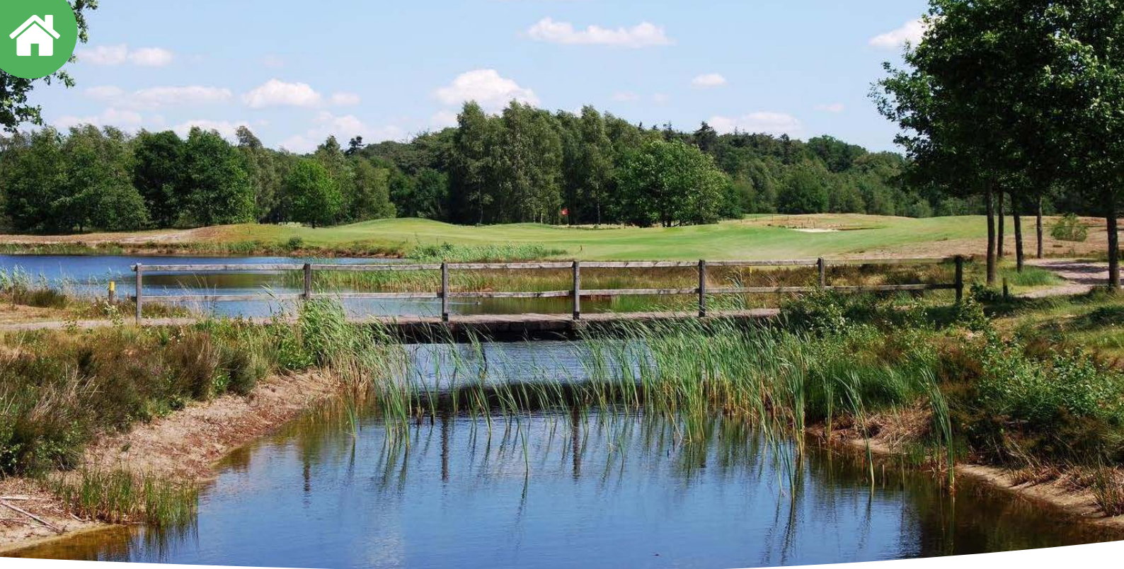
2024 Golf Court (RK)